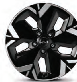
Jantes en alliage de 17 po