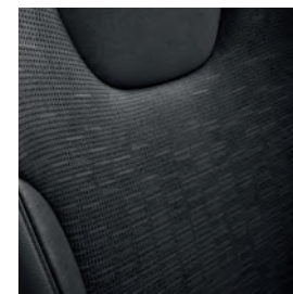
Cuir synthétique Noir charbon