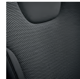
Tissu et cuir synthétique Noir charbon