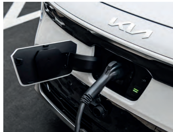
Port de chargement à l'avant