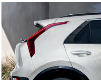
Blanc neige nacré