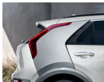
Blanc neige nacré, avec pilier C et garnitures latérales gris*

* Disponible uniquement sur la version Wave. Certaines associations de peinture extérieure, de sellerie et de version peuvent être limitées. Veuillez visiter kia.ca pour obtenir tous les détails.