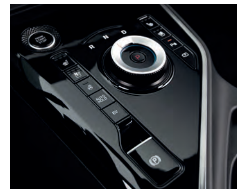
Transmission électronique de série