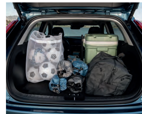
Hayon intelligent à commande électrique en option et espace de chargement maximal de 1 805 L (63,7 pi 3 ) lorsque les sièges arrière sont rabattus.