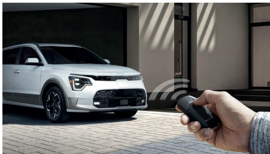
Assistance intelligente au stationnement à distance optionnelle