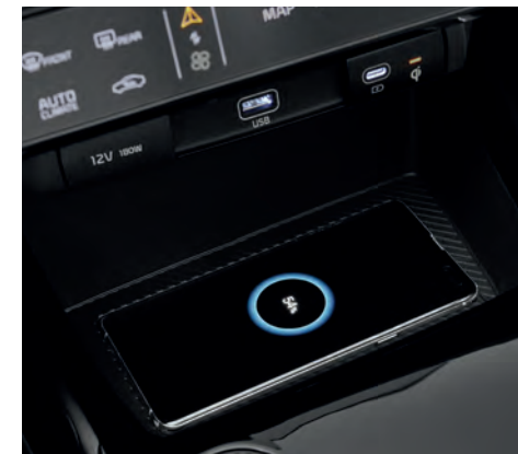
Chargeur de téléphone sans fil optionnel

L'espace de conduite moderne inclut un tableau de bord Supervision de 10,25 po et un écran multimédia de la même taille. Toutes les informations dont vous avez besoin sont ainsi à portée de main.