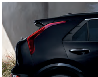
Noir aurore nacré