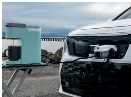
Prise CA de 120 V en option pouvant alimenter vos appareils